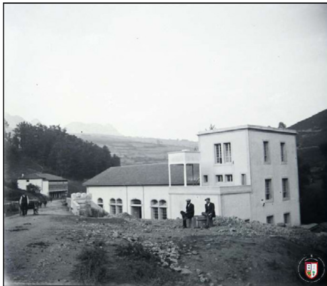
Central Hidroeléctrica, Regules 1915.

/ Abordar la gestión de los ríos, en nuestra opinión, debe considerar la parte emocional que nos une a ellos. Nuestra memoria está vinculada, en mayor o menor medida, a recuerdos en torno a los sistemas fluviales, algunos positivos y otros negativos. Estos ayudan a conformar un imaginario que será determinante en los procesos de toma de decisiones al abordar la gestión de los ríos de una manera participada .