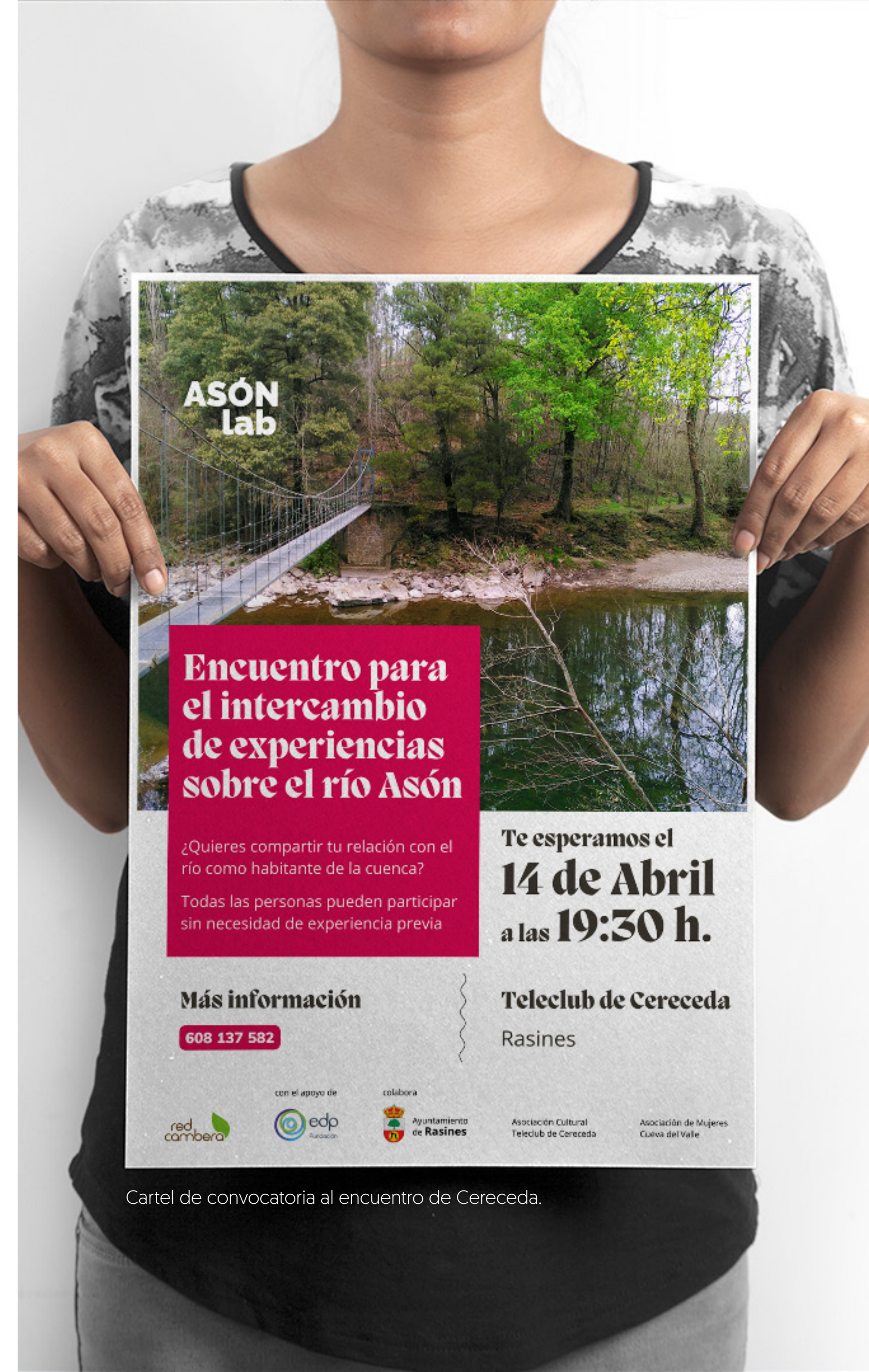
Cartel de convocatoria al encuentro de Cereceda.

/ Para dar a conocer el proyecto quedamos con los diferentes grupos que ya estaban activos en los municipios del valle y que realizan actividades de manera rutinaria. A estos grupos les ofrecimos participar en un primer encuentro, para el que ellos pusieron fecha y lugar según sus preferencias. Una vez que tuvimos fijada la fecha y lugar, realizamos una convocatoria pública mediante carteles, nota de prensa y entrevistas en medios locales, que nos permitió llegar a un mayor número de personas.