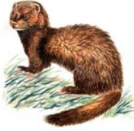
Visón americano Mustela vison