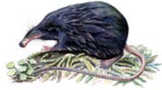
Desmán ibérico Galemys pyrenaicus