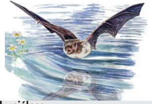
Murciélago de ribera Myotis daubentoni