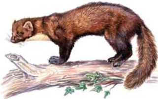
Marta Martes martes "Martuju, rosmilla"