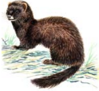
Visón europeo Mustela lutreola