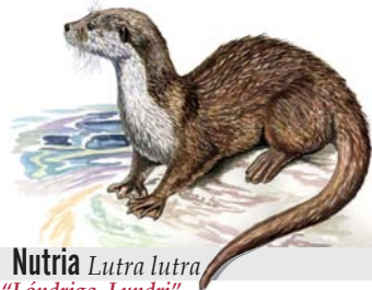
Nutria Lutra lutra "Lóndriga, Lundri"