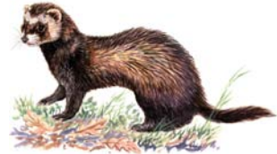
Turón Mustela putorius